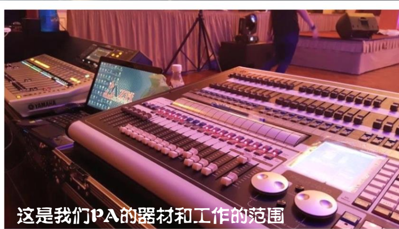
这是我们PA的器材和工作的范围