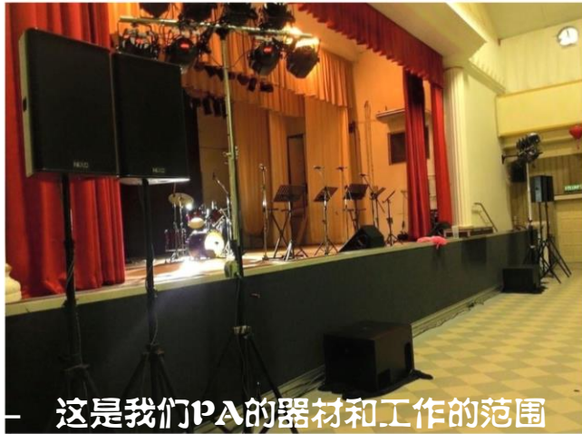
这是我们PA的器材和工作的范围