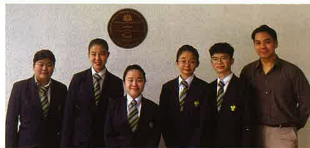
2024年度全国华文独立中学国语论坛比赛(A区) ——冠军 2024年度全国华文独立中学国语论坛比赛 ——安慰奖